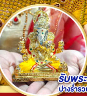
รับพระพิฆเนศ ปางรำรอย ท่านละ 1 องค์