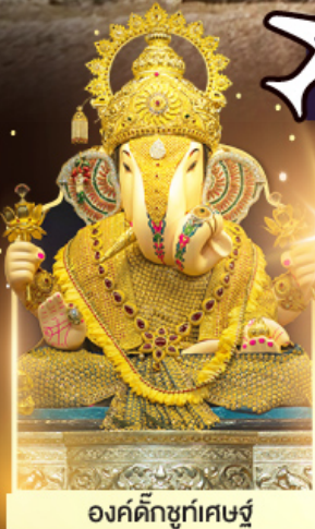
องค์ดีกษุทีพิเศษ