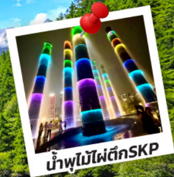
น้ำพุไม้ไฟตึกSKP