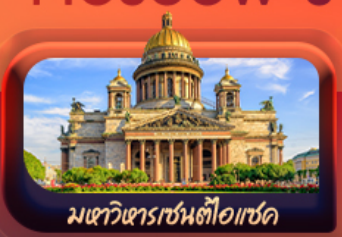
มหาวิหารเซ็นต์ไอแซค