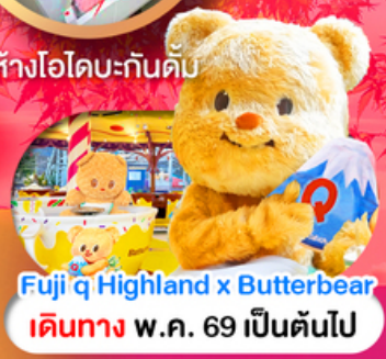
Fuji q Highland x Butterbear เดินทาง พ.ศ. 69 เป็นต้นไป