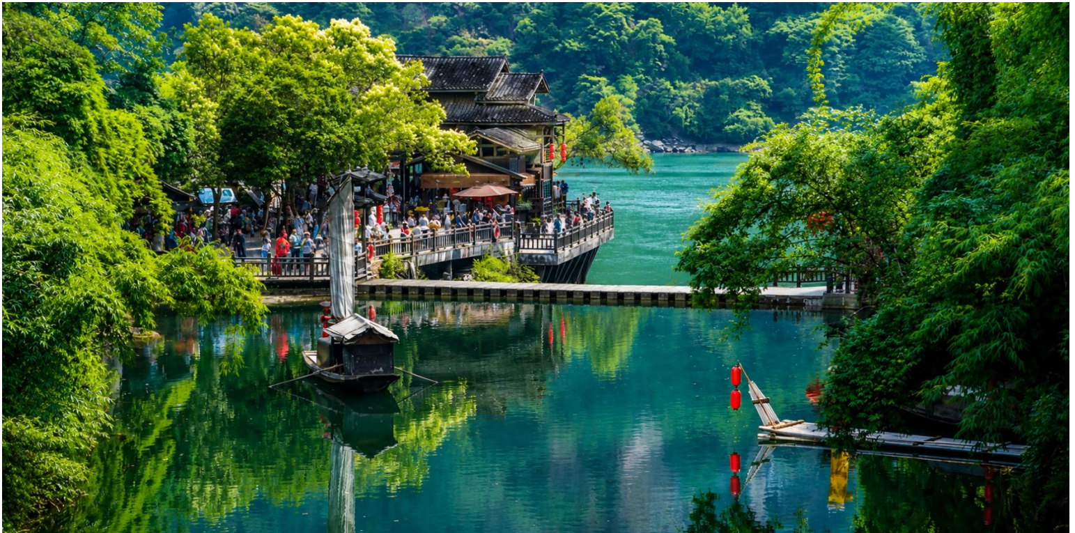
เที่ยง บริการอาหารเที่ยง ณ ภัตตาคาร (มื้อที่2)

นำท่านสู่ หมู่บ้านซานเซียเหรินเจีย (Sanxia Renjia) (รวมล่องเรือ) สถานที่นี้เป็นที่รู้จักกันในชื่อ หมู่บ้านสามผา แห่งท่องเที่ยวระดับ 5A ตั้งอยู่ในเขตหุบเขาสามผา ริมแม่น้ำแยงซีเกียง โดดเด่นด้วยทัศนียภาพทางธรรมชาติอันงดงามของ ภูเขาหินผา สายน้ำ และหุบเขาที่โอบล้อมกันอย่างกลมกลืน สถานที่แห่งนี้สะท้อนวิถีชีวิตดั้งเดิมของชาวลุ่มแม่น้ำแยงซีเกียง ผ่านสถาปัตยกรรมพื้นบ้าน วัฒนธรรม ประเพณี ที่ยังคงเอกลักษณ์ไว้อย่างครบถ้วน พร้อมให้ท่านได้ชมการแสดง เรื่องราวเกี่ยวกับวิถีชีวิตควบคู่กับสายน้ำ