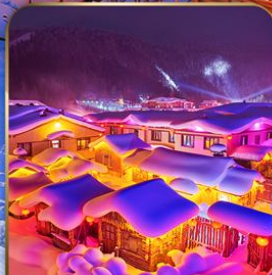
หมู่บ้าน DREAM HOME