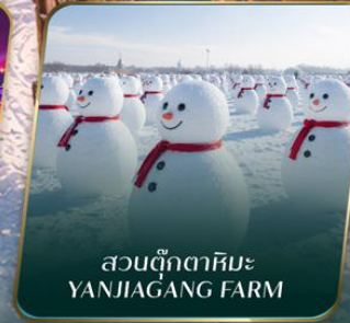
สวนตุ๊กตาหิมะ YANJIAGANG FARM