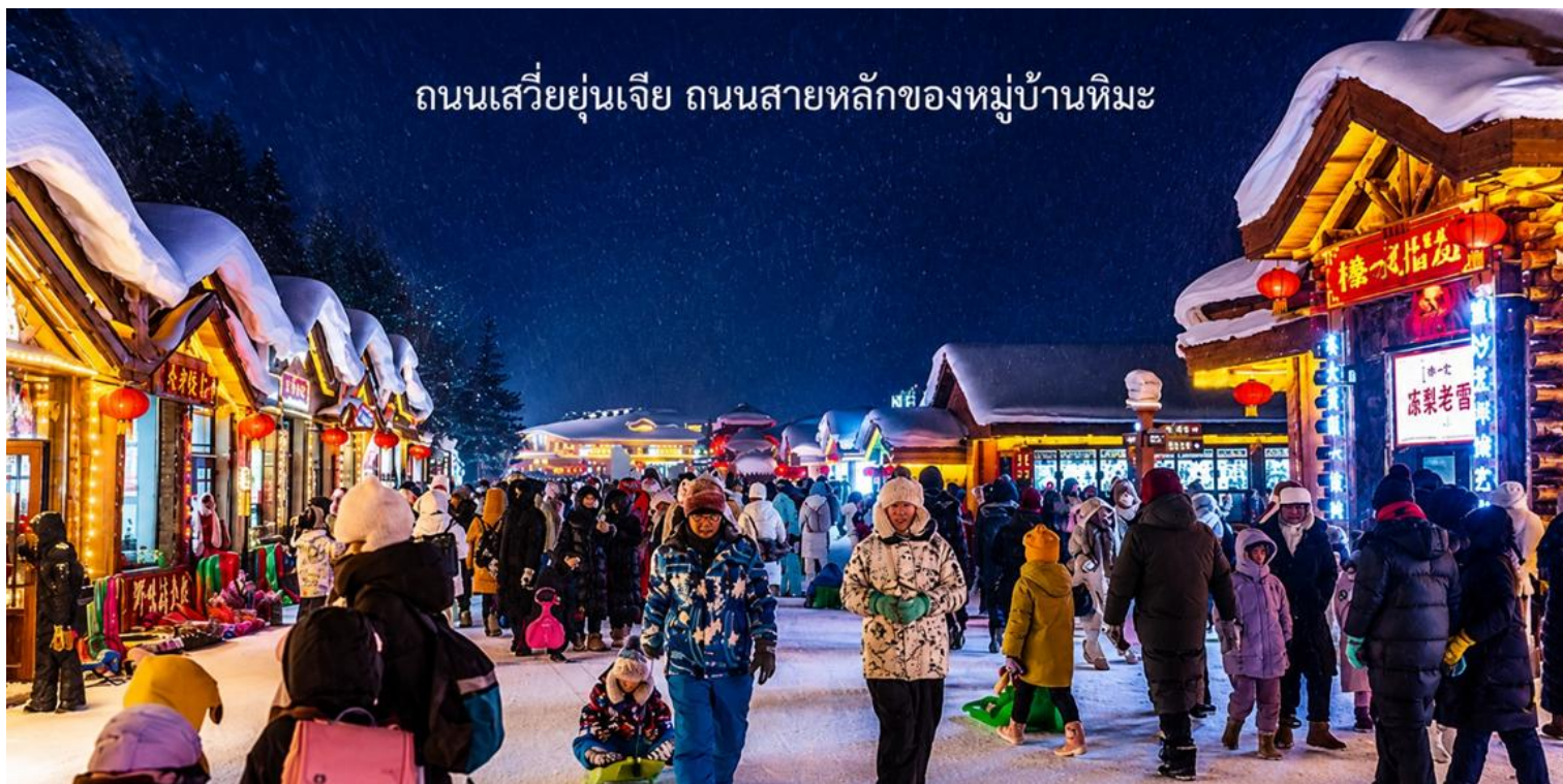
ถนนเสวี่ยยุ่นเจีย ถนนสายหลักของหมู่บ้านหิมะ

นำท่านเดินชมบรรยากาศบน ถนนเสวี่ยยุ่นเจีย ถนนสายหลักของหมู่บ้านหิมะ ที่ได้เต็มไปด้วยร้านค้าของที่ระลึก ร้านอาหารท้องถิ่น และร้านกาแฟน่ารัก ๆ ถนนสายนี้ถูกตกแต่งด้วยไฟประดับและโคมแดงสไตล์จีน เพิ่มเสน่ห์ให้บรรยากาศอบอุ่น และมีชีวิตชีวาที่ท่านสามารถช้อปปิ้งสินค้าท้องถิ่น หรือสินค้าแฮนด์เมด พร้อมถ่ายภาพเก็บความทรงจำในมุมสวย ๆ ของหมู่บ้าน ได้ตลอดทั้งคืน