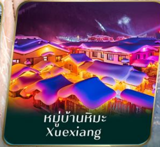
หมู่บ้านหิมะ Xuexiang