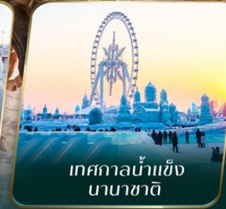
เทศกาลน้ำแข็ง นานาชาติ