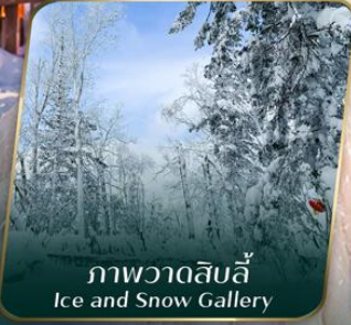
ภาพวาดสิบลี้ Ice and Snow Gallery

ตั๋วเครื่องบินออกเดินทาง ตั้งแต่ 15 วันขึ้นไป