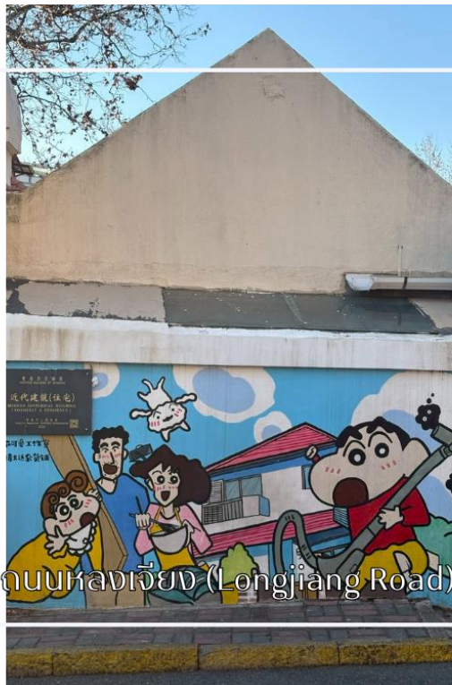
ถนนหลงเจียง (Longjiang Road)