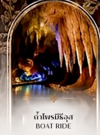
ดำโพรมีรีจัส BOAT RIDE

เดินทางช่วงปีใหม่ 27 ธ.ค. - 3 ม.ค. 70 ราคาเพียง 75,989 บาท / ท่าน