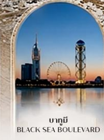
บากูมี BLACK SEA BOULEVARD