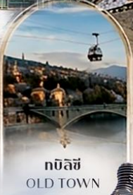
ทบิลีซี OLD TOWN