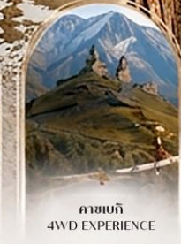
คาสเบก 4WD EXPERIENCE