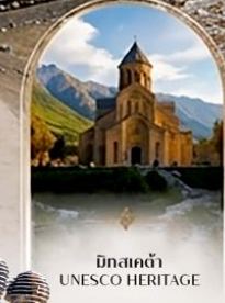
มัทสคด้า UNESCO HERITAGE