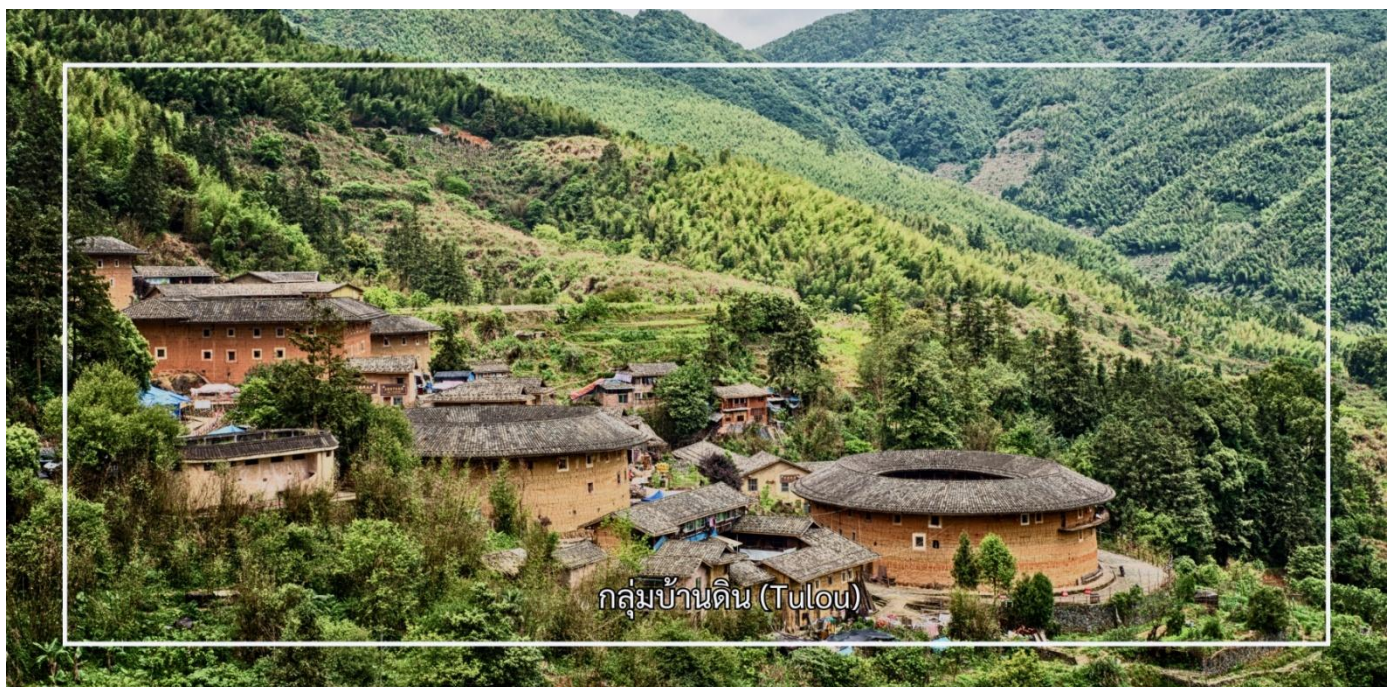
กลุ่มบ้านดิน (Tulou)

เที่ยง รับประทานอาหารเที่ยง ณ ภัตตาคาร (มื้อที่ 3)