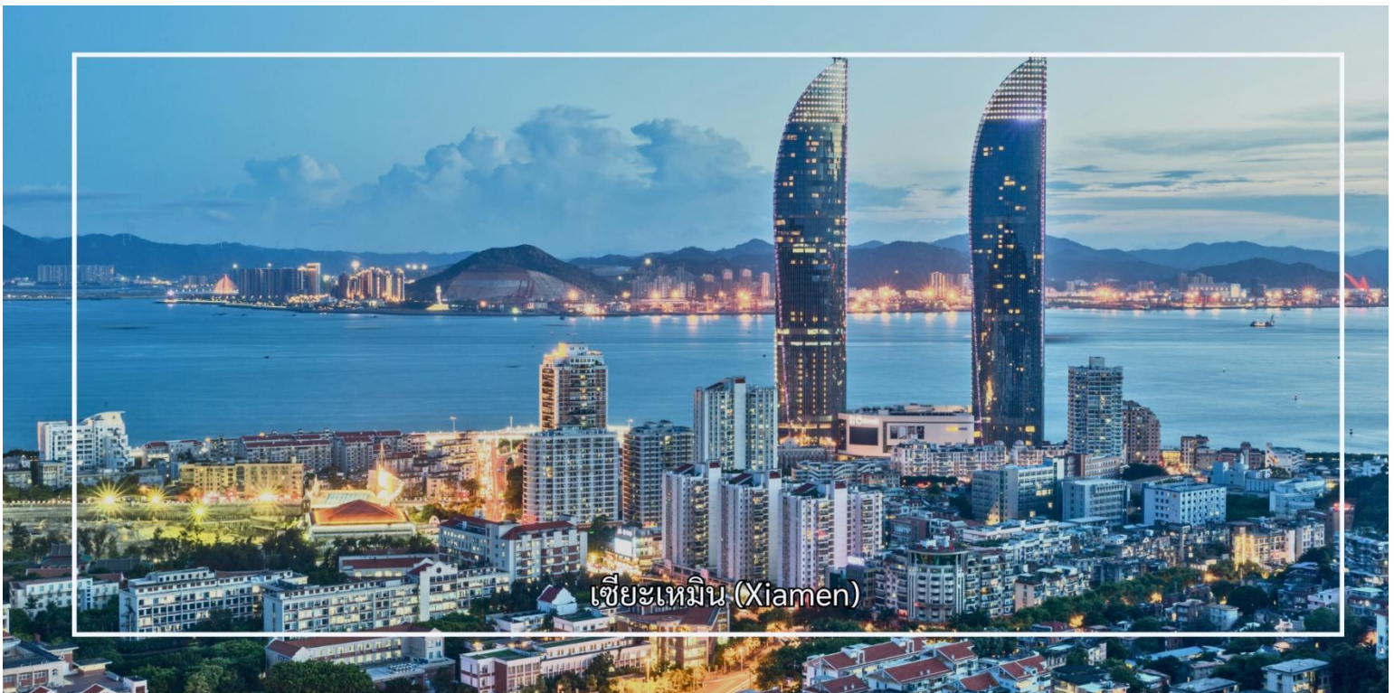
เซี่ยเหมิน (Xiamen)

นำท่านสู่ กลุ่มอาคารโบราณหมู่บ้านจีเหมย แหล่งท่องเที่ยวทางวัฒนธรรมที่สำคัญและสะท้อนเอกลักษณ์ทาง สถาปัตยกรรมของชาวจีนโพ้นทะเลอย่างโดดเด่น อาคารส่วนใหญ่สร้างขึ้นในช่วงต้นศตวรรษที่ 20 โดยเงินเจียเกิง