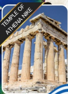
TEMPLE OF ATHENA NIKE