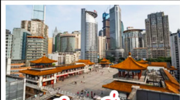
ตึกชุยซิง