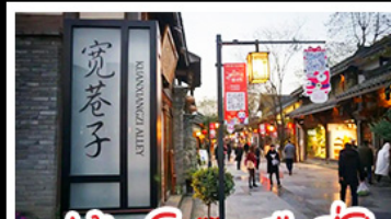
หมู่บ้านโบราณฉือชิว