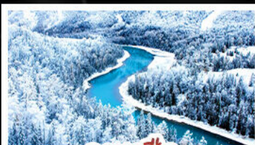
ดาเนาอ๊อ

ลุยอุทยานระดับโลก ชมความงามของอ่าวสีเขียวจินตรา อ่าวซ็อนมิงกรและอ่าวเทพทวดคา หมู่บ้านห่อมู๋ เขื่อนหมู่บ้านไม้ซุงสุดคลาสสิก พร้อมขึ้นจุดชมวิวดูหมอกยามเช้า นครปีศาจจิ้งจอก นั่งรถไฟชมวิว ทุ่งดินแดนหินล้านปีที่ถูกลมทะเลสลัดอย่างวิจิตร