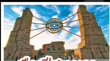
เมืองปีศาจจิ้งจอก