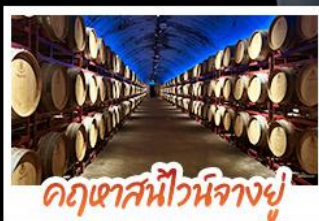
คฤหาสน์ไวน์นางยู๋