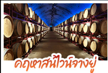
คฤหาสน์ไวน์นางอยู่