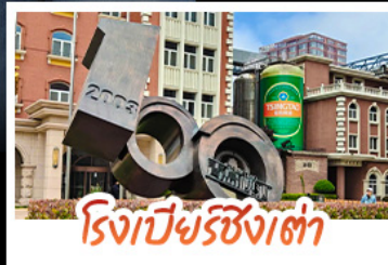
โรงเบียร์ชิงช้า