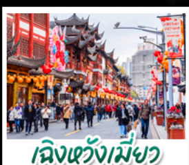
เมืองเซี่ยงเหมียว