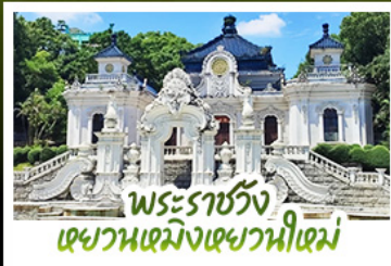
พระราชวัง เขาวนเมิ่งเขาวนหนี่เม่