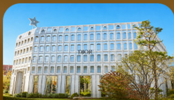
ผ่านชองซู