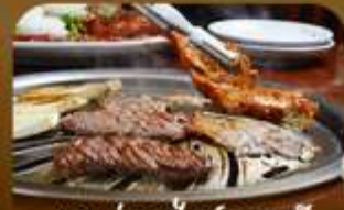
เมนูช่างสไตล์เกาหลี