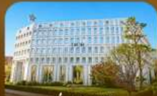
ย่านซองซู