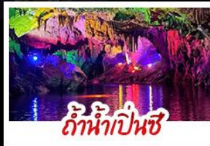
ถ้ำน้ำเป็นสี