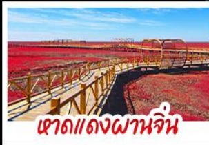
หาดแดงผานจิน