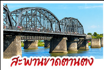
สะพานขาดตานตง

2 มหัตศงวรรษัรรมชาติระดับโลก "หาดแดงผานจีน" คู่กับ "ถ้ำน้ำเป็นซี" ยืนมองฝั่งเกาหลี่เหนือที่ตามตง • ชมความยิ่งใหญ่ของพระราชวังสี่นหยางทุกง