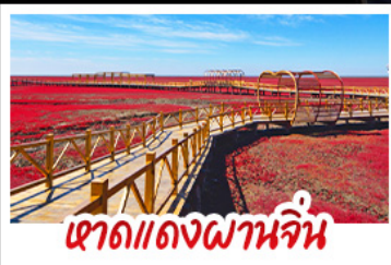
หาดแดงผานจีน