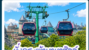
นั่งกระเช้าบานาฮิลล์