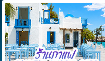
ร้านอาหาร SON TRA MARINA CAFE