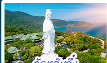
วัดเซ็กอิน