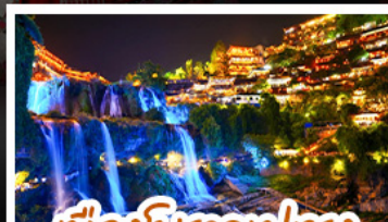
เมืองโบราณฝูเฉวง