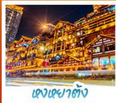
เฉิงเตาตั้ง

อุทยานหลุมฟ้า สะพานสวรรค์ • อุทยานเขานางฟ้า • หงหยาดัง • ดิกฟูยชิ่ง ชั้น 22 • วัดต้าอือ ชมรถไฟ-สุดึก • สะพานโบราณหนานเฉียว • เมืองโบราณกวนเซี่ยน • อุทยานภูเขาสี่ดรุณี อุทยานต้ากู่ปิงชวาน • จุดชมวิวหยางเกี้ยนหู่ • รูปปั้นหมี่แพนต้าบอมเซอเฟ้ • ร้านหนังสือจงซูเทอ ถนนคนเดินซุนซีอู่ • หมี่แพนต้าปิงตึก IFS • ถนนไถ่กู่หลี่ • ถนนโบราณชอยกวางชอยเตอ