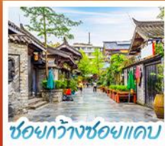
ชองกวางชอยแคบ