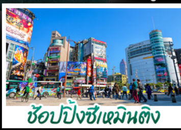
ซูปpingซีเหมินติง