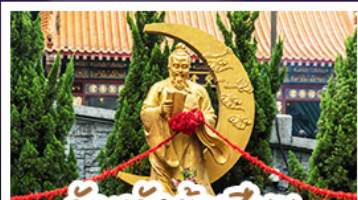
วัดเซกงต้าเซียน