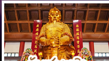
วัดเซกงเซมิว