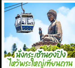
นั่งกระเช้าเองปีง ไต้วพระใหญ่เทียนถาน