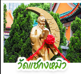
วัดเซกตหมีว