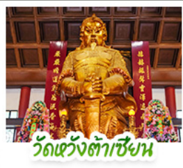
วัดเซว้งต้าเซียน

พัก 4 ดาว ย่านช้อปปิ้งจิมซาจ่ยหรือย่านมงก๊ก สนุกสนานไปกับสวนสนุกดิสนีย์แลนด์แบบเต็มวัน (รวมรถรับ-ส่ง) วัดหวังต้าเซียน หอพรदानุสฎภาพ • วัดเซกตหมีว หอพรโชคลาก การจับและรูดึง • เจ้าแม่กวนอิมฮ่องฮ่า นมัสการองค์เจ้าแม่กวนอิม ที่มีอายุกว่า 600 ปี • นั่งกระเช้าเองปีงสิฎการะพระใหญ่เทียนถาน