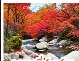
ภูเขาเหมี่ซางซาน