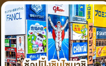
ช้อปปิ้งชินโซบาชิ และโดตงโมริ