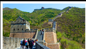
กำแพงเมืองจีนด่านจวิงกวน