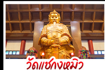
วัดเขงกงเดมิว