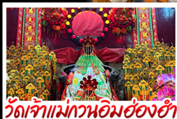
วัดเจ้าแม่กวนอิมฮองฮำ