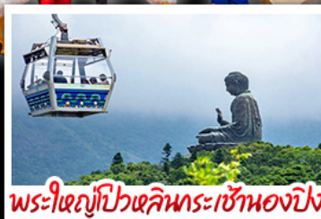
พระใหญ่ไผ่หลินกระเชอรองปีง