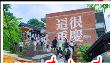
ตรอกซี้ซ่าวหลี่