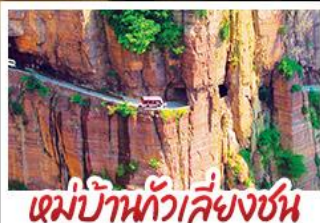
หมู่บ้านกัวลี้ยงชุน