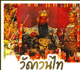
วัดกวนน้้ท