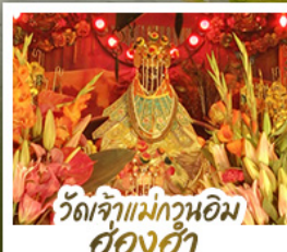
วัดเจ้าแม่ทวนอิม ฮ่องฮ่า