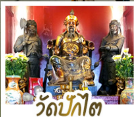
วัดป้กต้