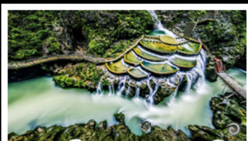
แกรนด์แคนยอนถงเหริน

เขาฟ้าหิม - เมืองโบราณผู่แรงเงิน เมืองโบราณเฟิ่งหวง - เกาะสัมจิวโจว แกรนด์แคนยอนถงเหริน - ไม่เข้าร้านช้อป พักโรงแรม 5 ดาว - รถไฟความเร็วสูง