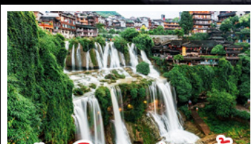
เมืองโบราณผู่แรงเงิน