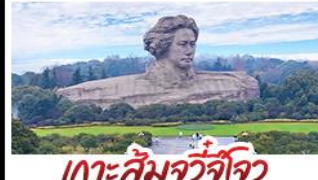
เกาะส้มจิวจื่อโจว