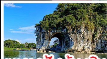
เขาวงกต กึ่งเอลิแ