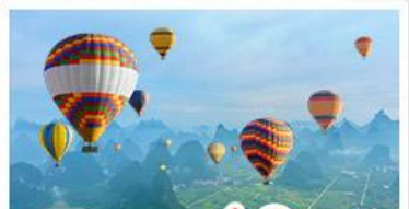
บอลลูนชมวิว 360