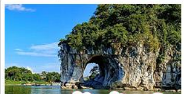
นางวงช้างกึ่งแกลิน