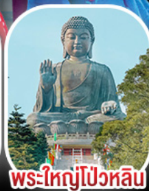
พระใหญ่โป้วหลิน