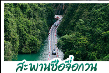
สะพานซื่อจื่อกวน