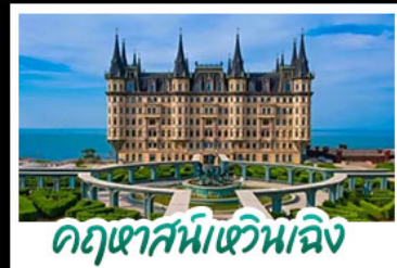
คุกาสัมหลวมอิง

เมืองเก่าซิงคโปร์ - คุกาสัมหลวมอิง เบียร์ซิงคโปร์ + อาหารทะเล สตรีทอาร์ต สตุตโตอิจิบลิ