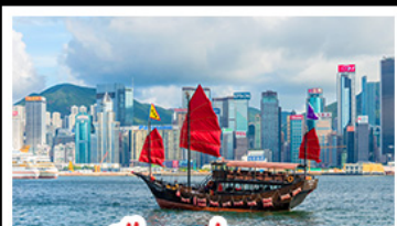
เมืองฮ่องกง

เมืองเก่าชิงเต่า - วิวเมืองฮ่องกง โรงเบียร์ชิงเต่า - ท่าเรือชาวประมงเยียนโก