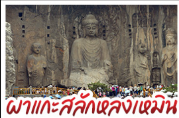
ถ้ำแห่งสลักเสลาพันองค์

เที่ยวครบ 4 มรดกโลก ถ้ำหลงเหมิน - สุสานจีนซีอาน - วัดเส้าหลิน หมู่บ้านใต้ดินสามโจ้ว - หมู่บ้านทิวลิ้งชุน