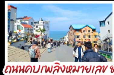
ถนนคบาเพลิงจินงมาหมายเลข ๘

สัมผัสความยิ่งใหญ่ของ 4 เมืองท่าสำคัญ ชิงเต่า - เยียนโต - เฟิงไห่ - เว่ย์ไต้ ปาด้ากวน - โบสร์คากอลิก - ตึกท่าริมหา