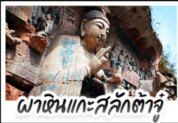
พาเดินแกะสลักต่าง ๆ