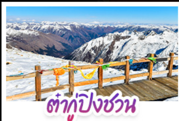
ต่ากู่ปิงชว่น