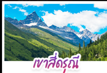
เขาสี่ฤดู