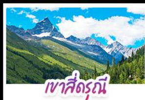
เขาสี่ดรุณี