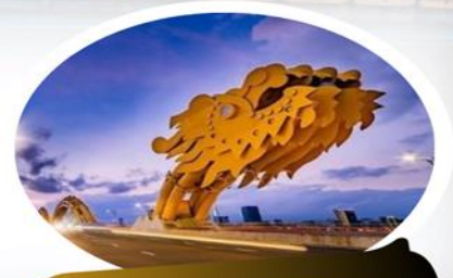
สะพานมังกร (Dragon Bridge)

นำท่านชม สวน APEC มุมถ่ายรูปสุดชิคที่ไม่ควรพลาดในดานัง ตั้งอยู่ริมฝั่งแม่น้ำฮาน ใกล้ๆ สะพานมังกร เมืองดานังนั่นเอง ซึ่งประเทศเวียดนามสร้างไว้เพื่อต้อนรับการประชุม APEC ที่ประเทศเวียดนามในปี 2017 โดยมีจุดเด่นคือเป็นโดมขนาดยักษ์ ที่สร้างมาจากเหล็ก 200 ตัน รูปทรงมีลักษณะเหมือน 'วาวยักษ์' ซึ่งใหญ่จริง และทาสีขาวได้อย่างลงตัว ถ่ายรูปออกมาสวยชิคทุกมุม