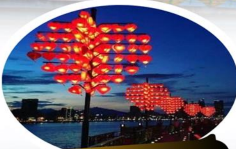
สะพานแห่งความรัก