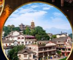
เมืองโบราณฉือจี้โข่ว