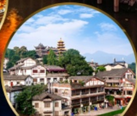
เมืองโบราณฉือฉีโป่ว