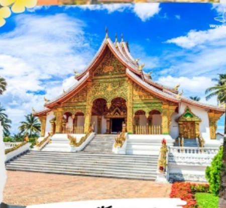
พระราชวังหลวง