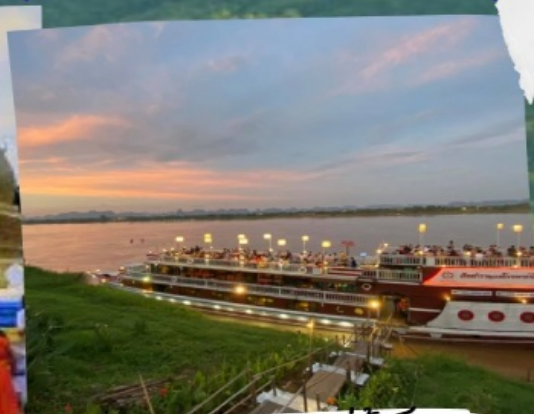
ล่องเรือแม่ฟ้าหลวง