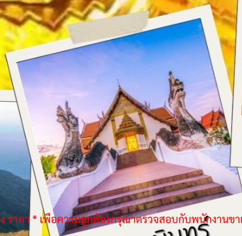
วัดดงกษัตริย์