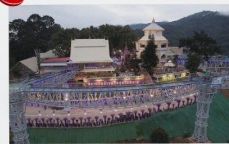
สกายวอล์ค

2 ท่านขึ้นไป 14,499 บาท/ท่าน 4 ท่านขึ้นไป 12,799 บาท/ท่าน 6 ท่านขึ้นไป