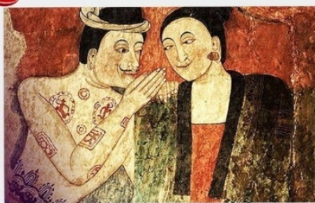
จิตรกรรมฝาผนังปูม่าน