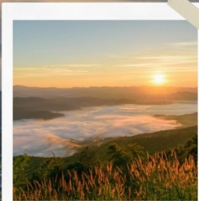
ทอย/สมอทาว