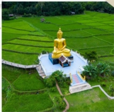
บ้านนาคูนา