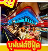
บูฟเฟต์ซีฟู้ด