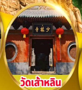
วัดเล่าหลิน