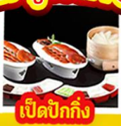
เปิดปีกกึ่ง