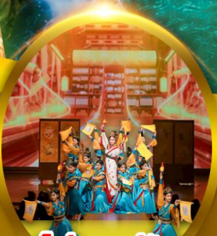
โชว์ราชวงศ์ถัง