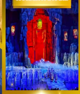
โชว์เส้นทางสายไหม