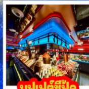
บุฟเฟต์ซีฟู้ด