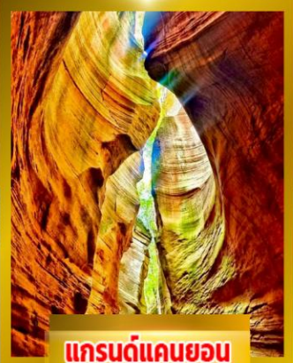
แกรนด์แคนยอน ยูวาโก